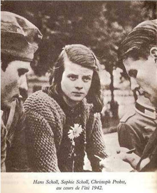
Hans Scholl, Sophie Scholl, Christoph Probst, au cours de l'été 1942.

Le film de ce mois rend témoignage à deux jeunes allemands, luthériens protestants, Hans et Sophie Scholl, qui au nom de leur foi en Jésus-Christ et au prix de leur vie, choisissent de résister et de dénoncer le totalitarisme du régime nazi dans l'Allemagne des années 1940. C'est ainsi qu'au printemps 1942, ils fondent avec leur ami Alexander Schmorell, le groupe de résistance « La Rose blanche ».